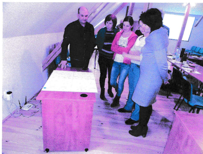
Obr. č. 1 – vytváření SWOT analýzy