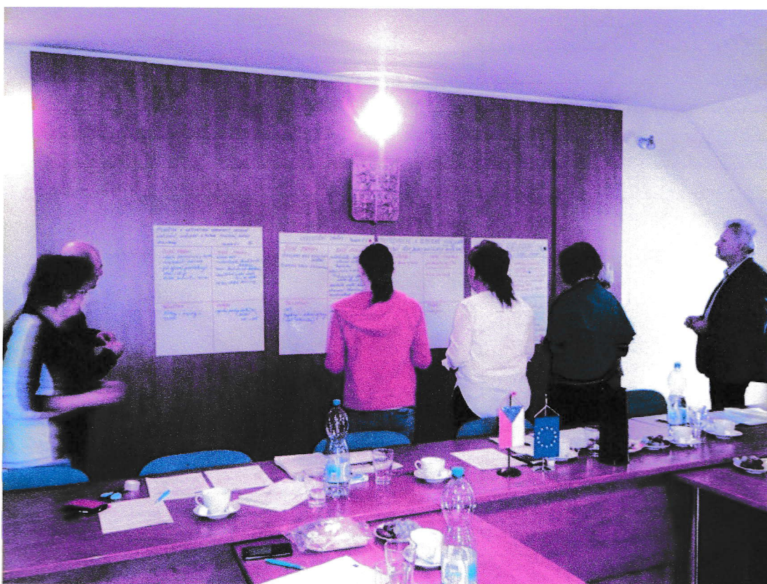
Obr. č. 2 – přiřazení důležitosti k jednotlivým SWOT analýzám